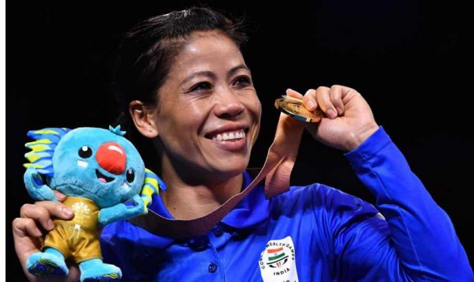
CGS Teachers Course - 27 October 2018